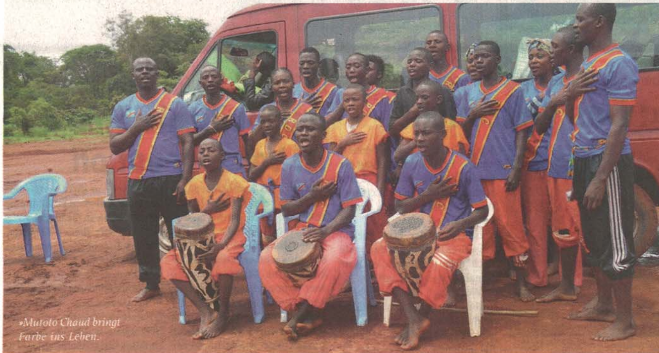
»Mutoto Chaud bringt Farbe ins Leben.