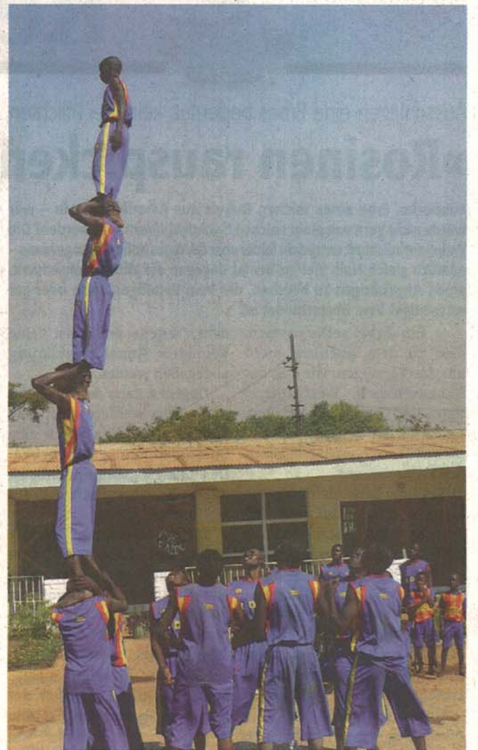
Hoch hinaus geht es bei dieser artistischen Nummer.

Karten für diese Veranstaltung bekommt man im Vorverkauf im Fanshop von André Stargard in Lübbecke, Lange Str. 2, direkt neben dem Reisebüro. Sie kosten im Vorverkauf 3 Euro für Erwachsene und 2 Euro für